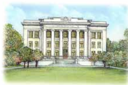
HARVARD MEDICAL SCHOOL

1.Tıp Eğitimi Günlerinin kapanışında katılımcılar bu deneyim ve bilgi paylaşımının çok verimli olduğunu bildirmişlerdir. Bu toplantıların her yıl diğer üniversitelerin de katılımıyla yapılması, monotematik olması ve gelenekselleşmesinin yararlı olacağı yönünde yaygın bir görüş ortaya çıkmıştır.