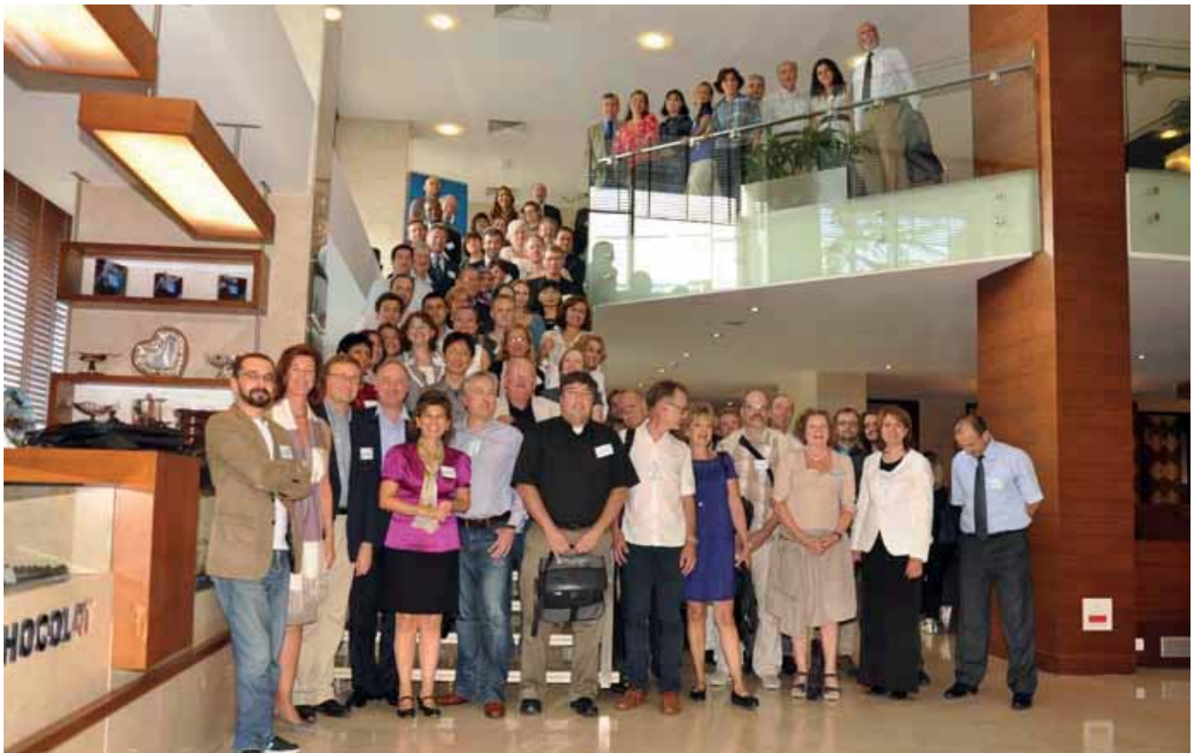
EACME 2011 Kongresi